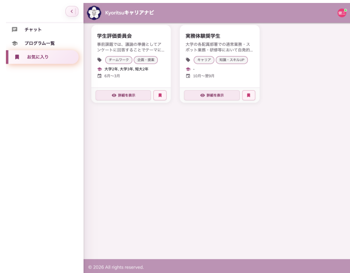
▲ 図 5-1 お気に入り画面

左サイドバーの【お気に入り】をクリックすると、自分が登録したプログラムの一覧が表示されます。