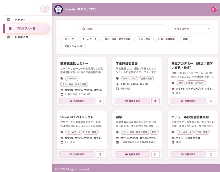
▲ 図 4-1 プログラム一覧画面

左サイドバーの【プログラム一覧】をクリックすると、公開中のすべてのプログラムをカード形式で確認できます。