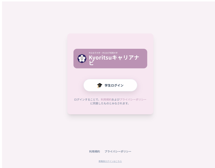
▲ 図 2-1 ログイン画面

ブラウザで「kyoritsu-career-navi.com」にアクセスすると、以下のログイン画面が表示されます。