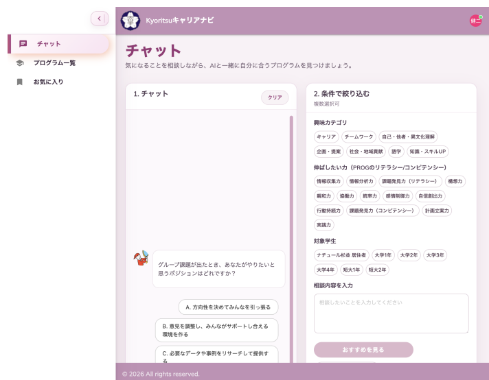
▲ 図 3-1 チャット画面 (全体)

ログイン直後に表示されるのがチャット画面 (/student/chat) です。左側のサイドバーから「チャット」を選択しても表示できます。