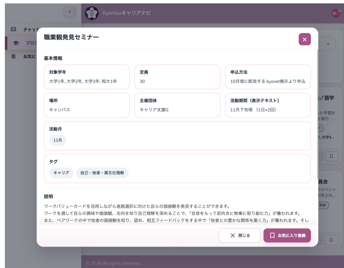
▲ 図 4-2 プログラム詳細モーダル（学生向け）